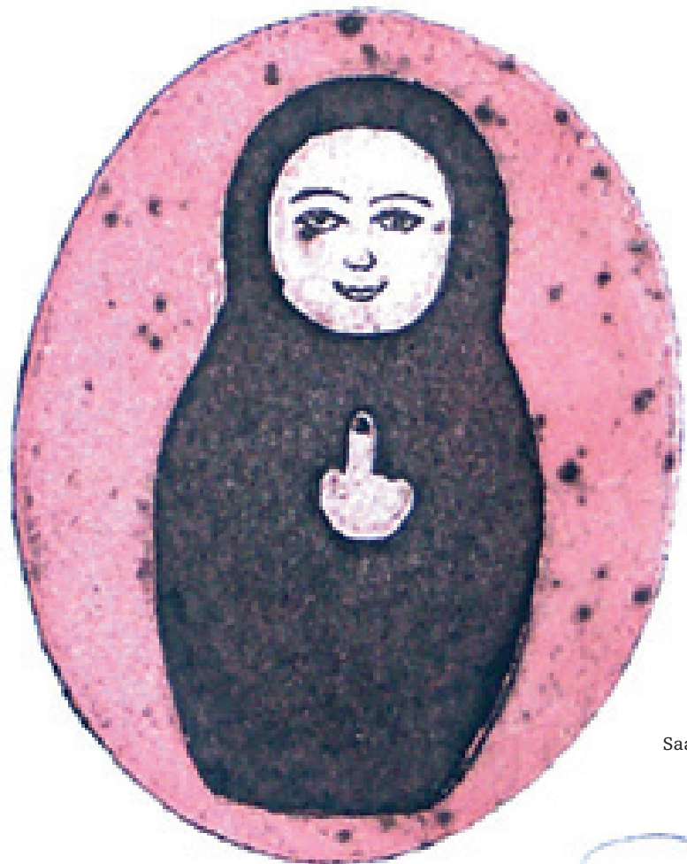
Saadia Hussain, ur sviten Let's play .